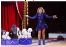
Killen som ramlade ner från himlen